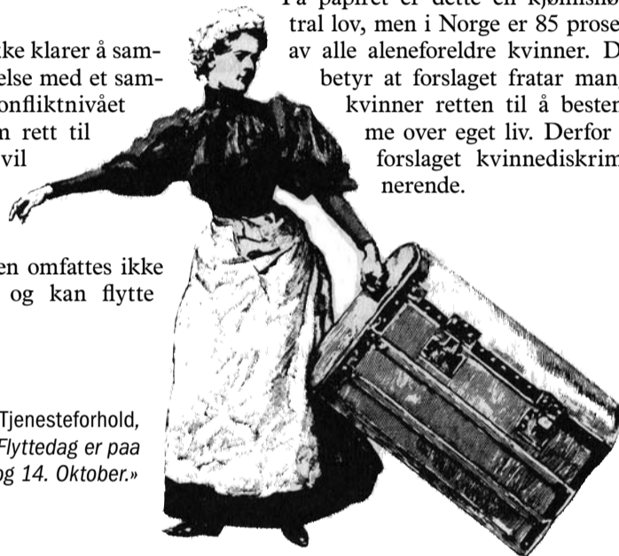
Fra boka Om Tjenesteforhold, Kristiania 1895: «Flyttedag er paa landet 14. April og 14. Oktober.»

På papiret er dette en kjønnsnøytral lov, men i Norge er 85 prosent av alle aleneforeldre kvinner. Det betyr at forslaget fratrar mange kvinner retten til å bestemme over eget liv. Derfor er forslaget kvinnediskriminerende.