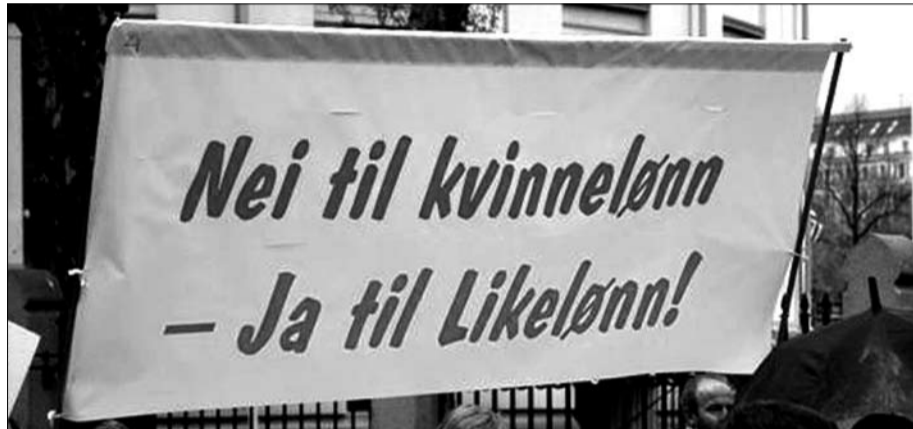
Fra 1. mai i Oslo

Yrker i offentlig sektor lønnes ofte drastisk mye lavere enn tilsvarende i privat, mens en god pensjonsordning med trygghet fra 62 år har vært et viktig gode. En svekket AFP-ordning vil svekke det offentlige som arbeidsplass for alle grupper av ansatte og gjøre det vanskeligere å rekruttere med sikte på å skape gode offentlige tjenester.