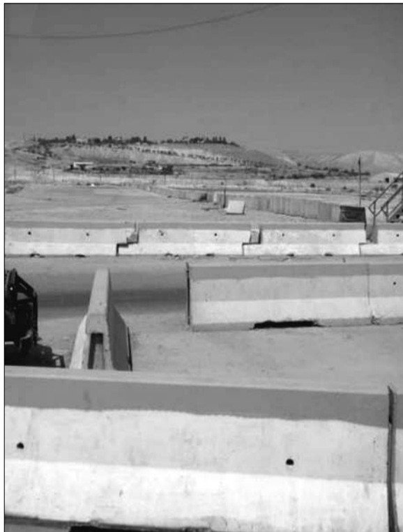
Kontrollpost. Med mange kantstein.

Her er det selvfølgelig også lang kø, men plutselig er det vår tur til å passere som neste bil. Bilen foran kjører gjennom, vi venter på klarsignal fra soldaten, han ser på bussen og bare går til side, akkurat som om han vil la oss passere uten noen videre kontroll. Og det er da det fatale skjer: Sjøføren kjører på feil side av en kantstein.