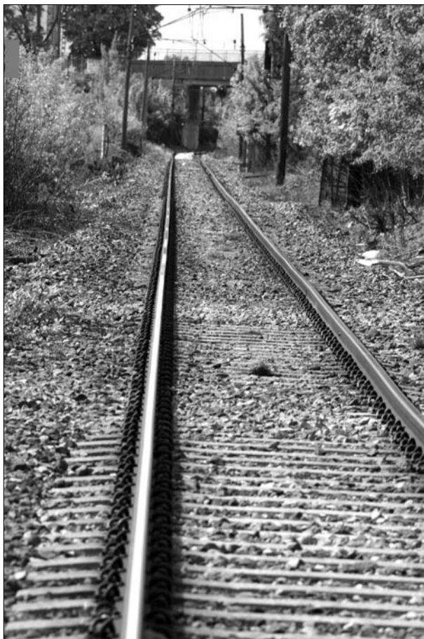
Tog eller veg?

Rødt mener det er svært viktig å framskynde