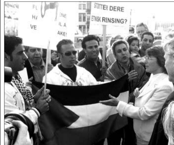
Bergen 14. mai 2008: I kraftig diskusjon med den israelske ambassadøren om rett til å vende tilbake for dei palestinske flyktingane, som har vore i flyktingeleirar i 60 år!