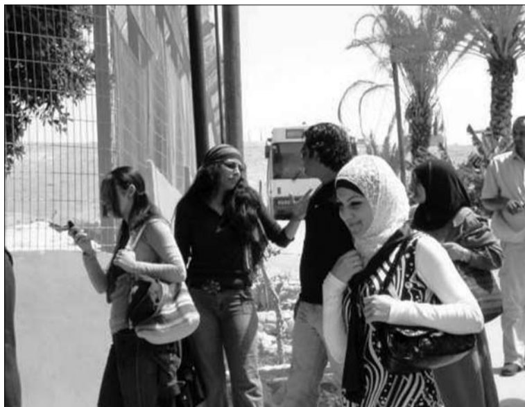
Etter mange problemer har vi kommet fram, her er deler av gjengen på vei inn i parken.

Han bestemmer seg for å kjøre de veiene hvor det er minst sannsynlig å treffe på kontrollposter, og det